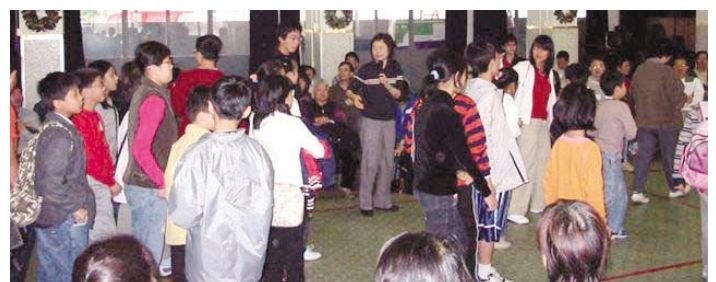
Movimiento Familiar de Hongkong