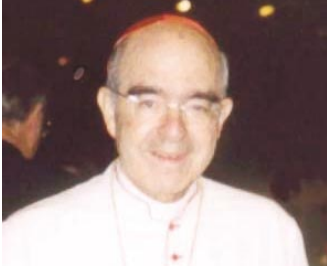
Alfonso Cardenal Lopez Trujillo