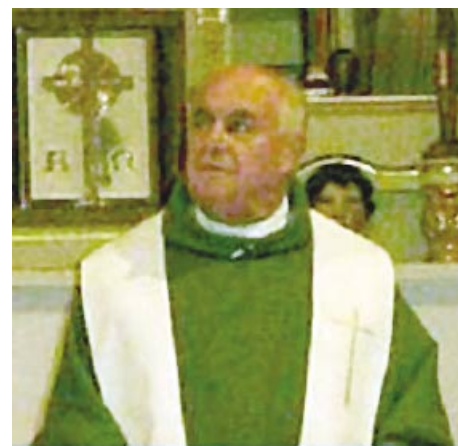
Homilia en la Asamblea Mundial de Familias 2004