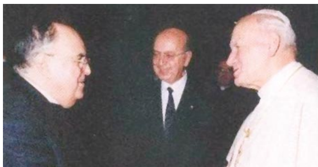
Una audiencia con su Santidad Papa Juan Pablo II